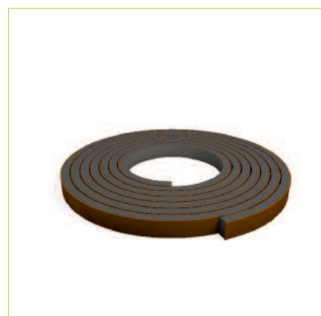
MTH GUARNIZIONE ADESIVA