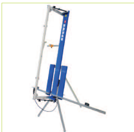
MTH TAGLIA POLISTIRENE 890 SL

Questo robusto e versatile dispositivo da taglio a filo incandescente, è molto apprezzato per i diversi tipi di taglio. L'apparecchio è pronto all'uso con pochi gesti. Le diverse scale per la lettura diretta delle dimensioni di taglio permettono di risparmiare il tempo impiegato per segnare i tagli sui pannelli d'isolamento.