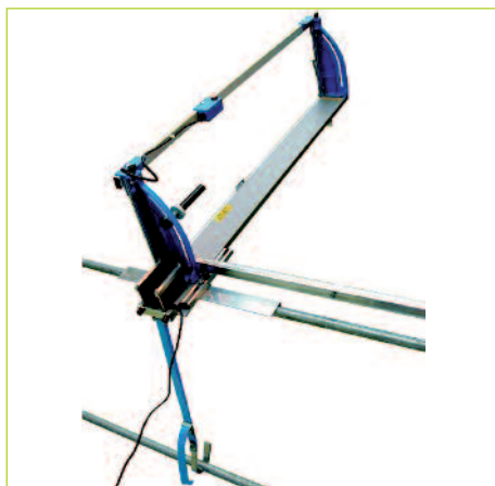
MTH TAGLIA POLISTIRENE 391 GT

Utensile da taglio leggero e maneggevole per materiali in schiuma rigida. Ideale come secondo apparecchio o per volumi di lavoro ridotti.