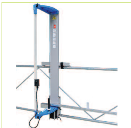
MTH TAGLIA POLISTIRENE 392 GT

Utensile da taglio a filo incandescente a sospensione, maneggevole e leggero. Ottimo come apparecchio secondario o per volumi ridotti di lavorazione. Può essere impiegato universalmente come modello da tavolo o a sospensione sull'impalcatura tramite il supporto apposito. Spostamento rapido, senza viti, guide a sfera precise per una grande comodità di taglio.