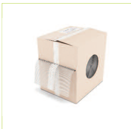
MTH PARASPIGOLO UNIVERSALE IN ROTOLI PVC